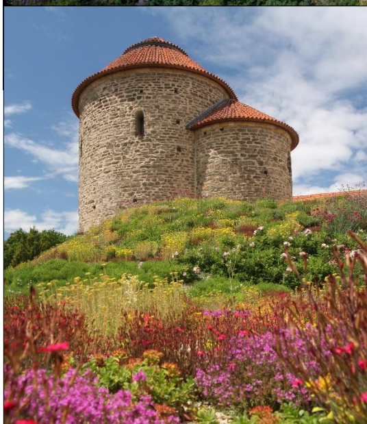
Vyhlídková terasa u románské rotundy sv. Kateřiny v areálu bývalého Znojemského hradu.