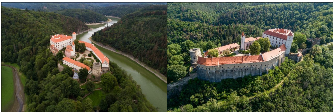
Hrad Bitov ( www.hrad-bitov.cz )