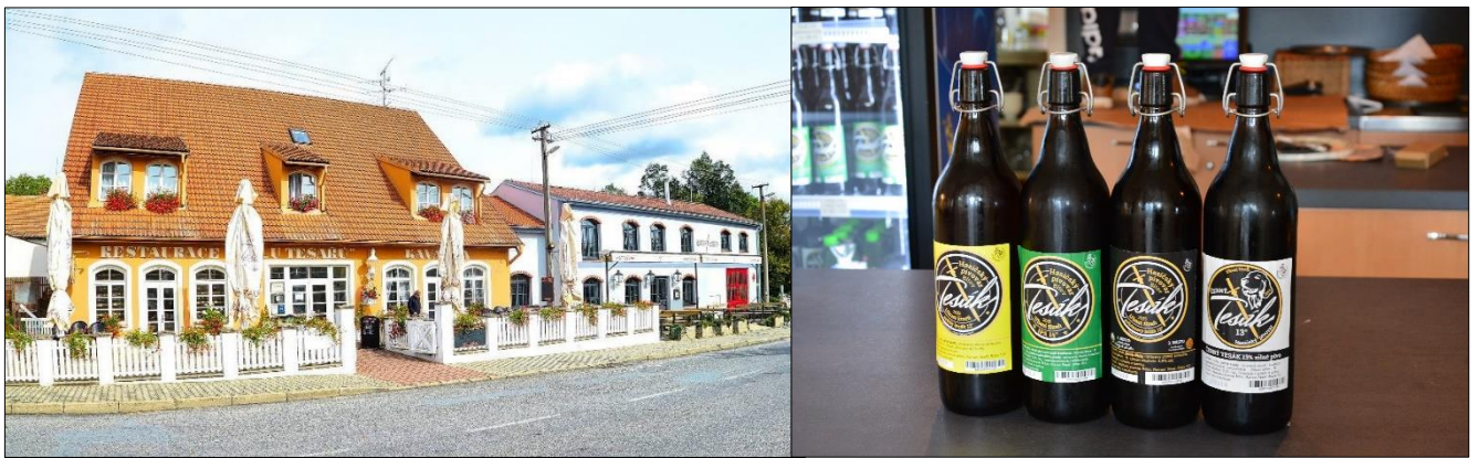
Restaurace U Tesařů a Hasičský pivovar v Bitově ( www.utesaru.cz )