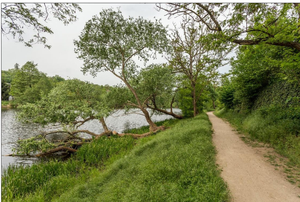
Cesta podél řeky Dyje.

Nízká bílá budova v popředí – prodej regionálních potravin a ovoce Farmy U Tří dubů.