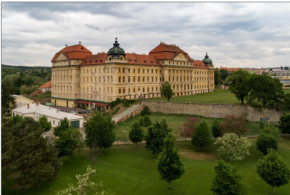
Loucký klášter ve Znojmě – Znovín Znojmo.

Nízká bílá budova v popředí – prodej regionálních potravin a ovoce Farmy U Tří dubů.