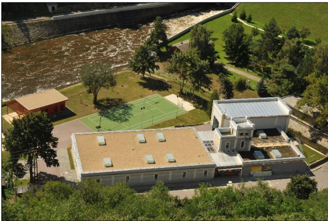
Vodácké centrum Stará vodárna.